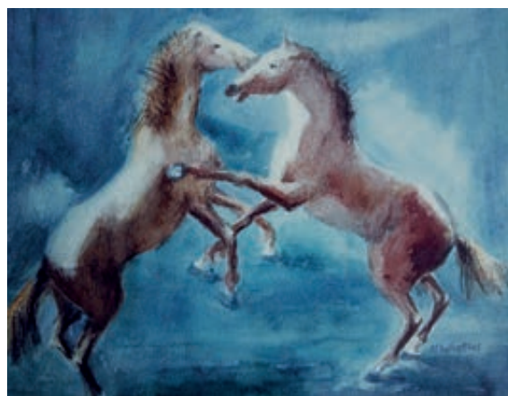
En la Alpujarra almeriense. Acuarela. 33x41