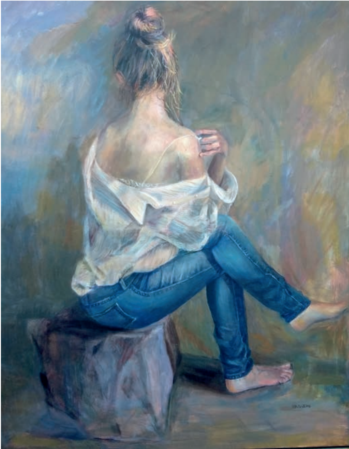
Chica de hoy. Óleo/lienzo. 116x89