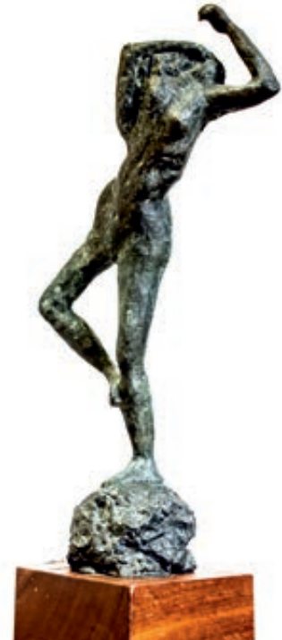
Síntesis. Bronce. 60x25x16