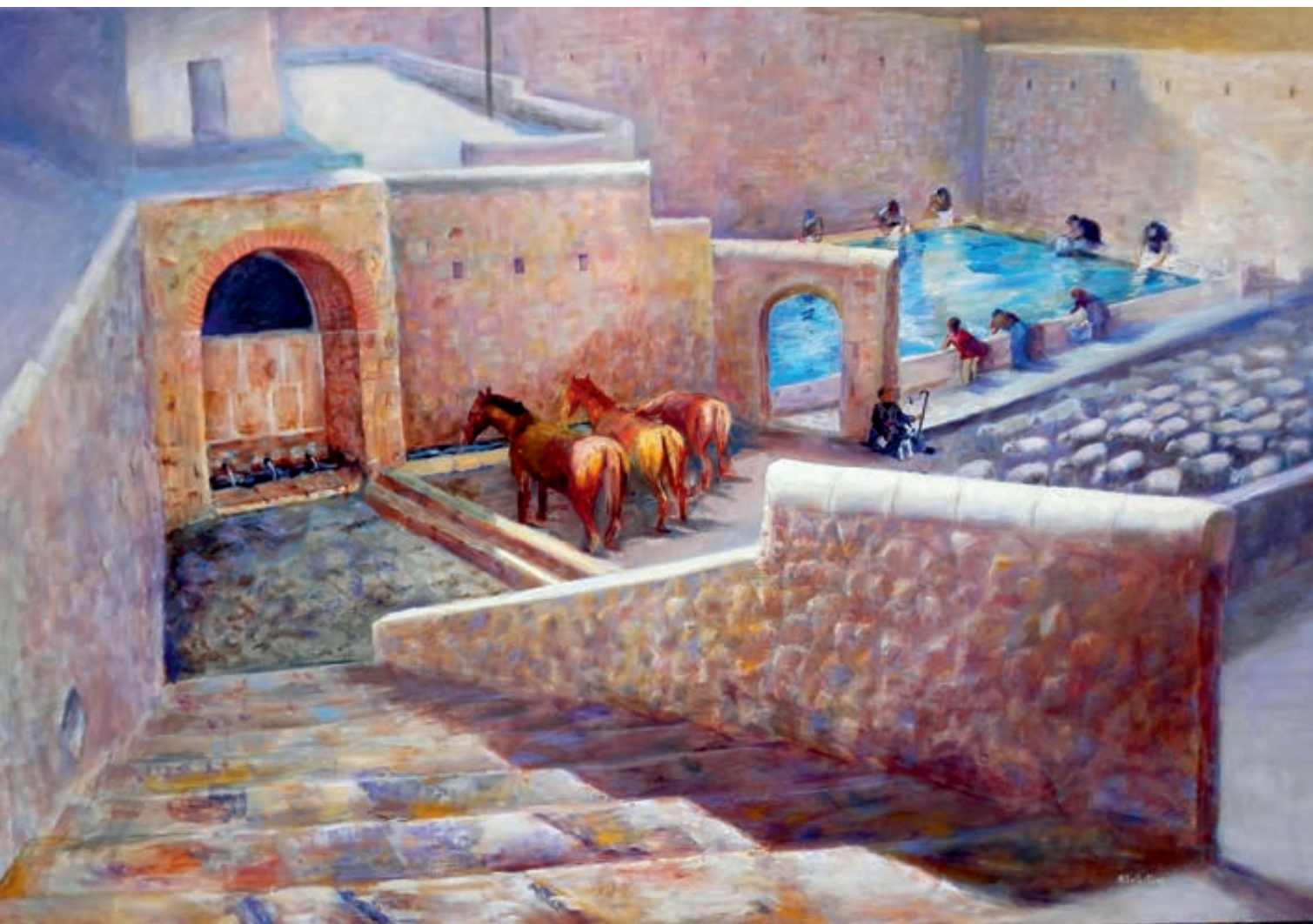
Fuente vieja. Óleo/lienzo. 114x165