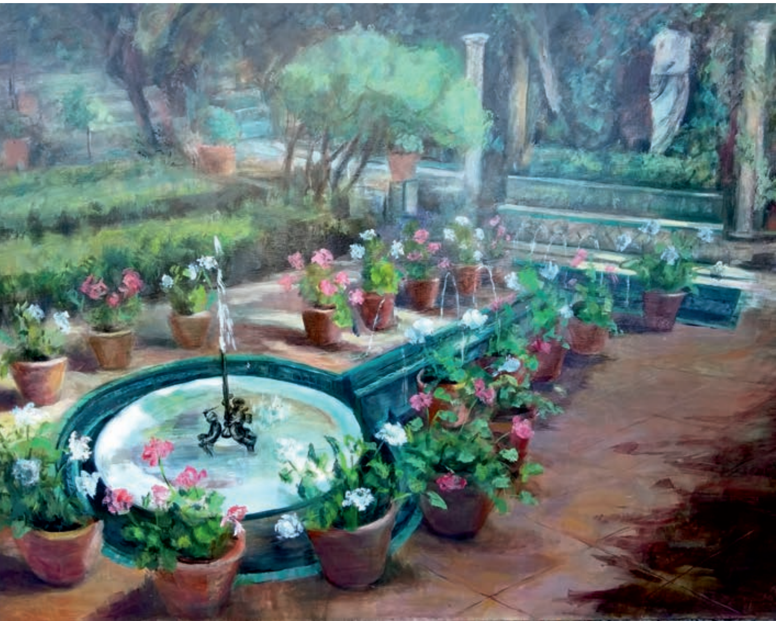
Jardín de Sorolla II. Óleo/lienzo. 102x127