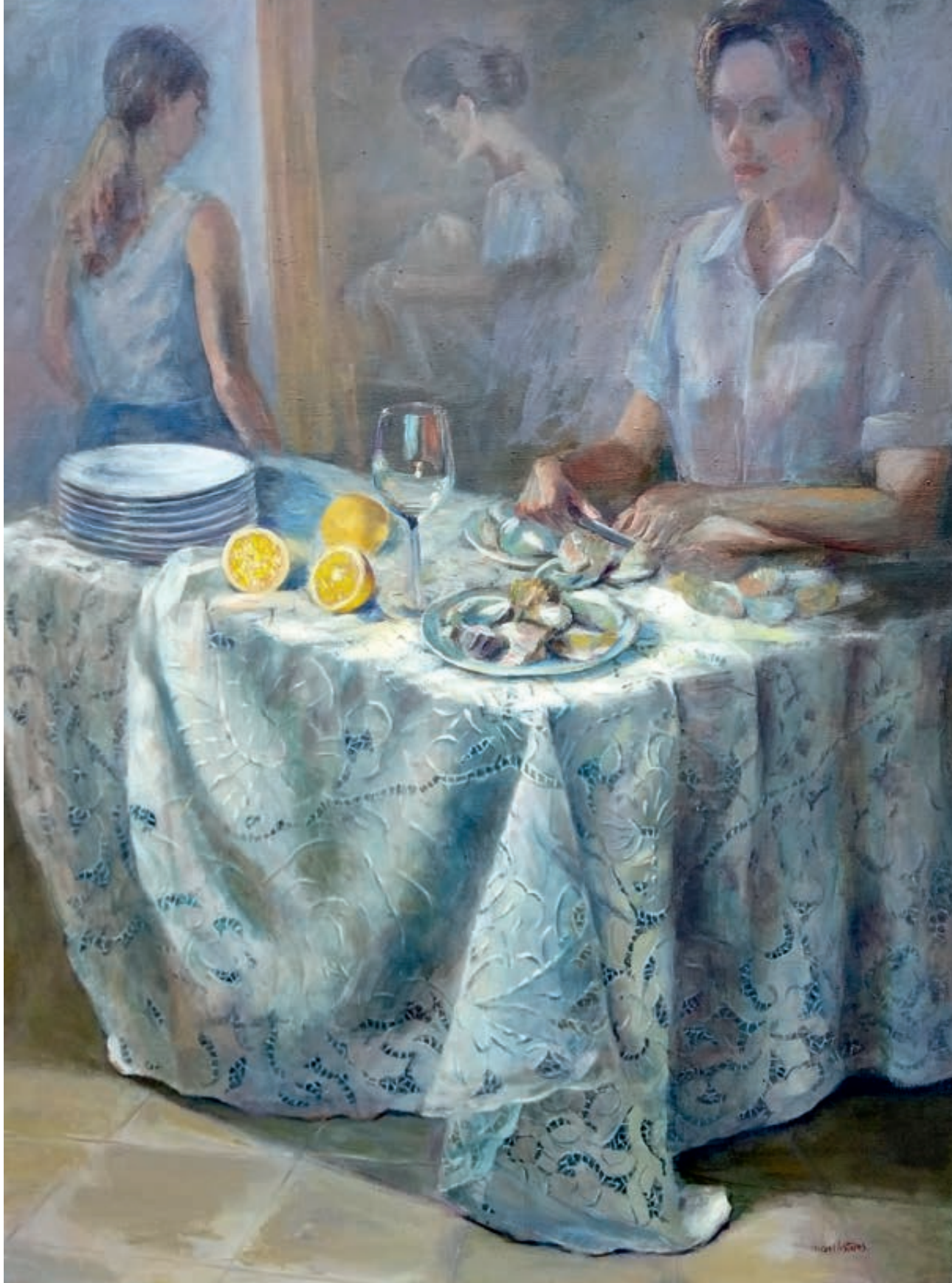
Abriendo Ostras. Óleo/lienzo. 116x89