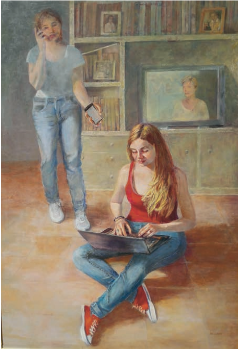
Conversación I. Óleo/tabla. 175x122