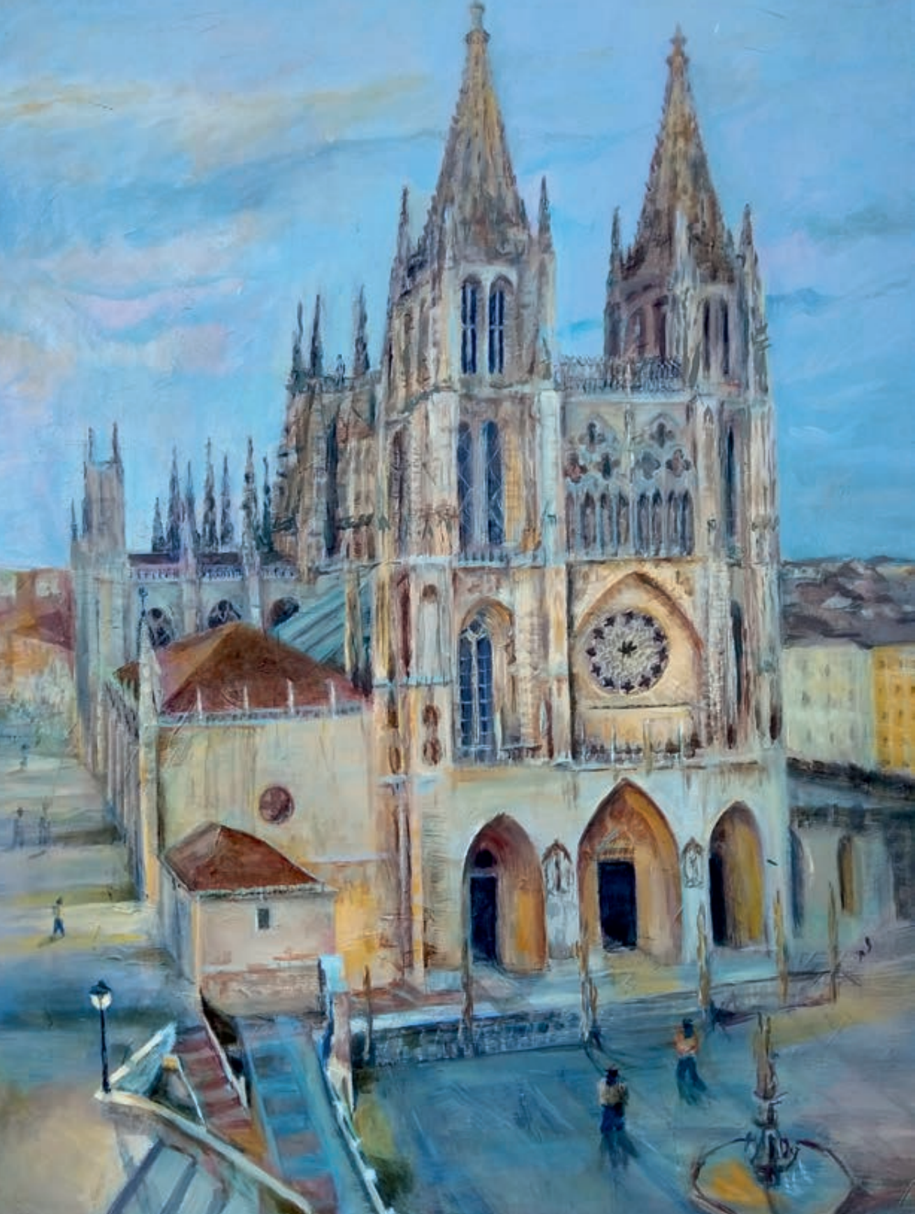
Burgos. Óleo/lienzo 146x114