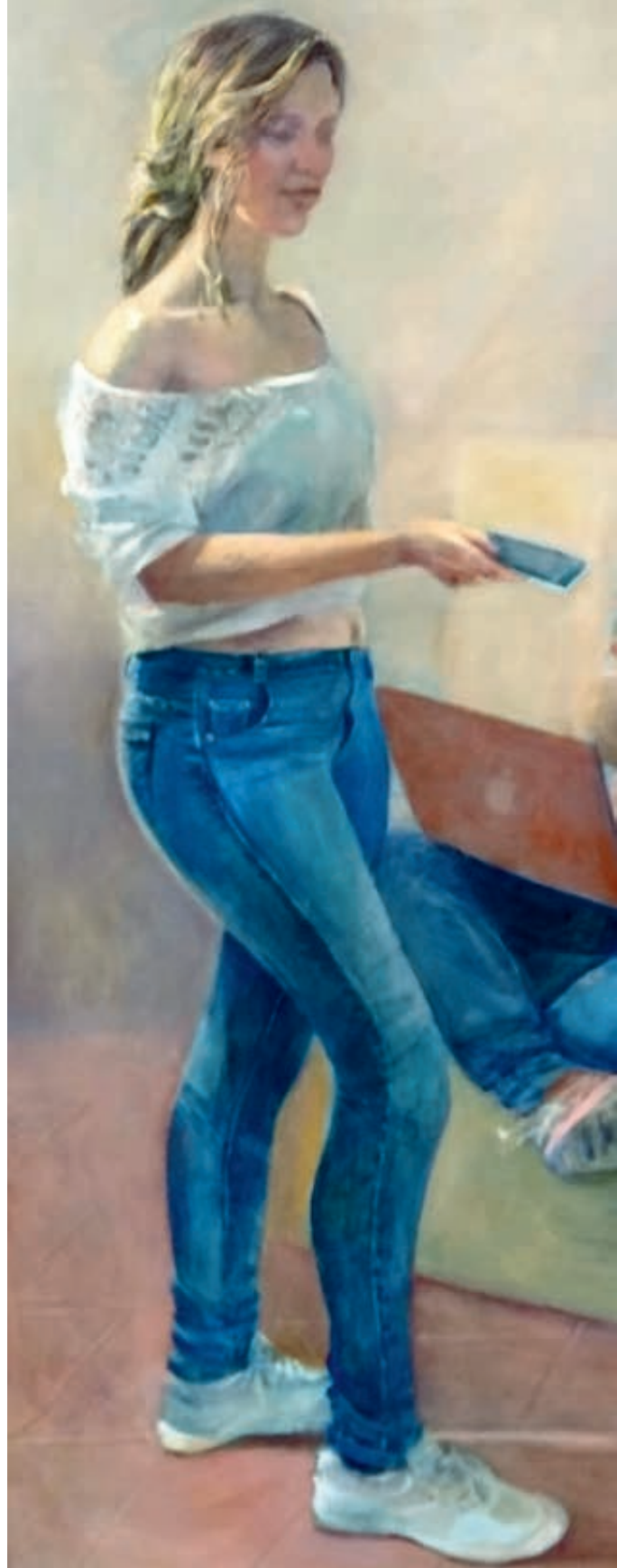
Conversación II . Óleo/lienzo. 146x163