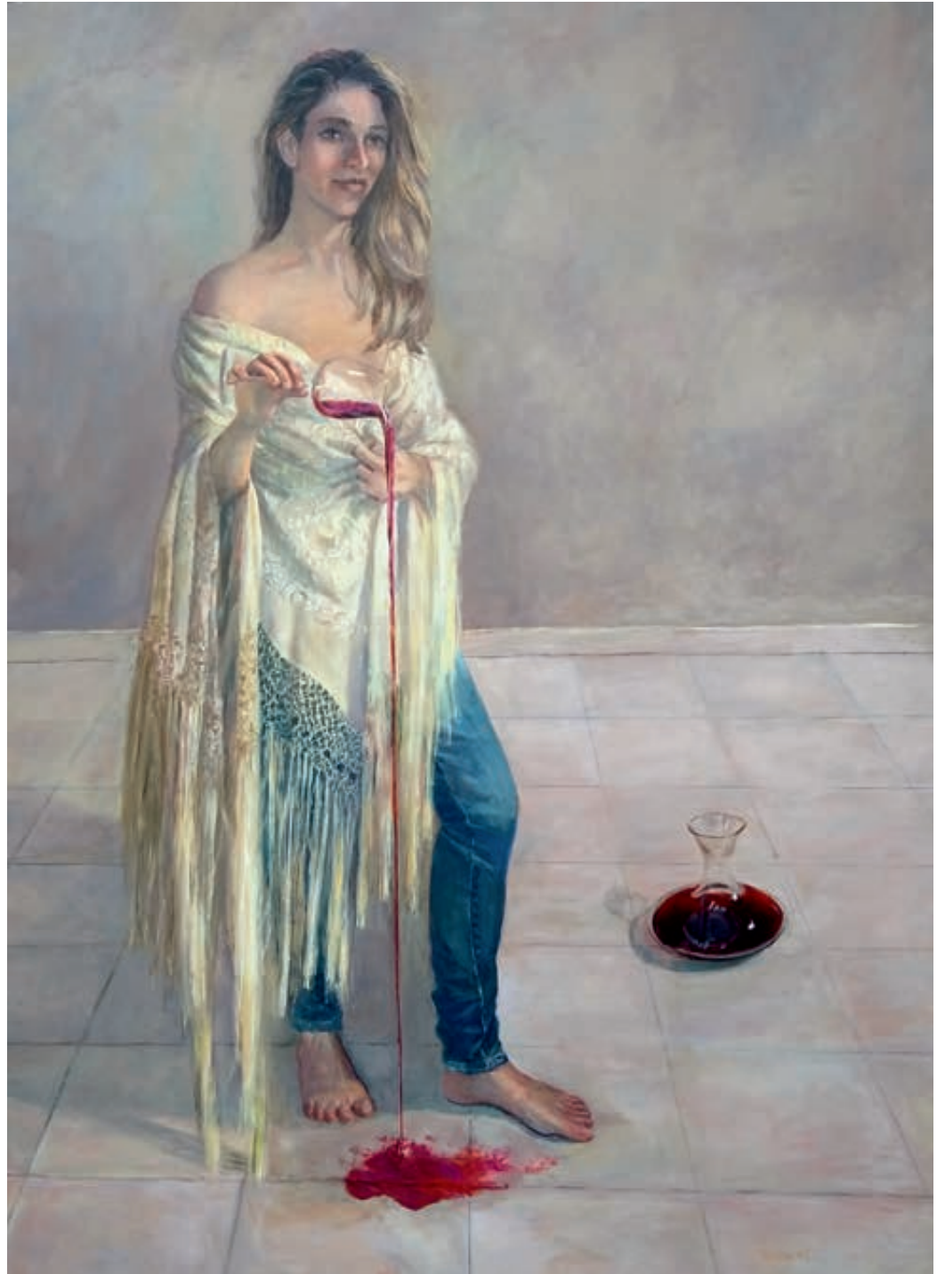
Lo bueno de mi tierra. Óleo/tabla. 175x122