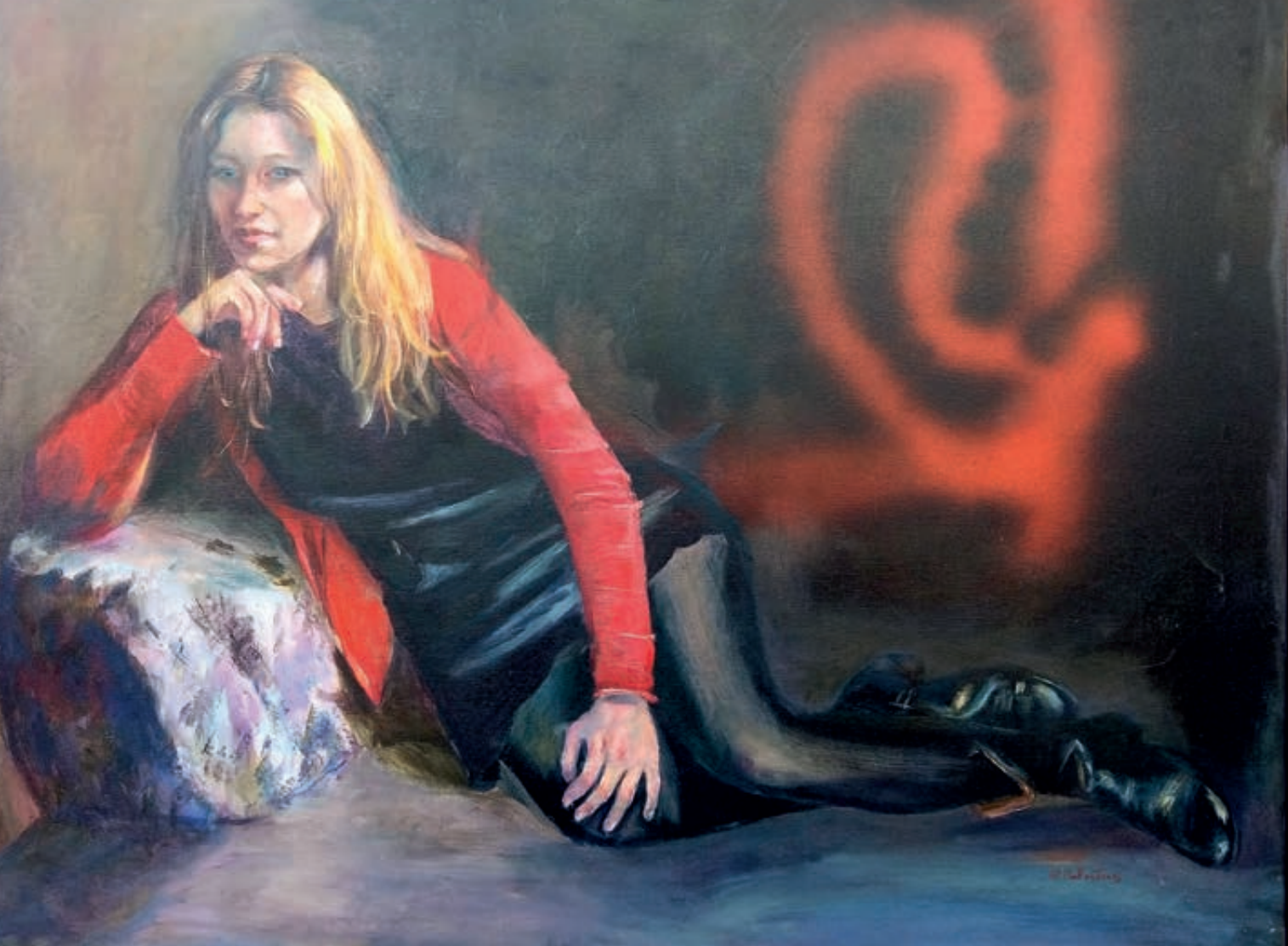
Rojo Negro. Óleo/lienzo. 89x116