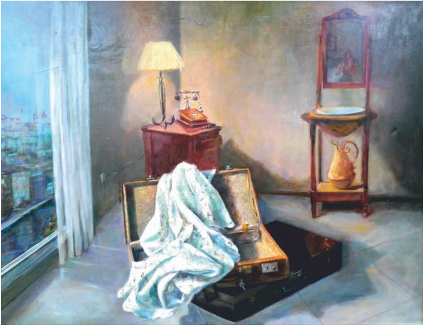
Tiempos pasados. Óleo/lienzo. 114x146