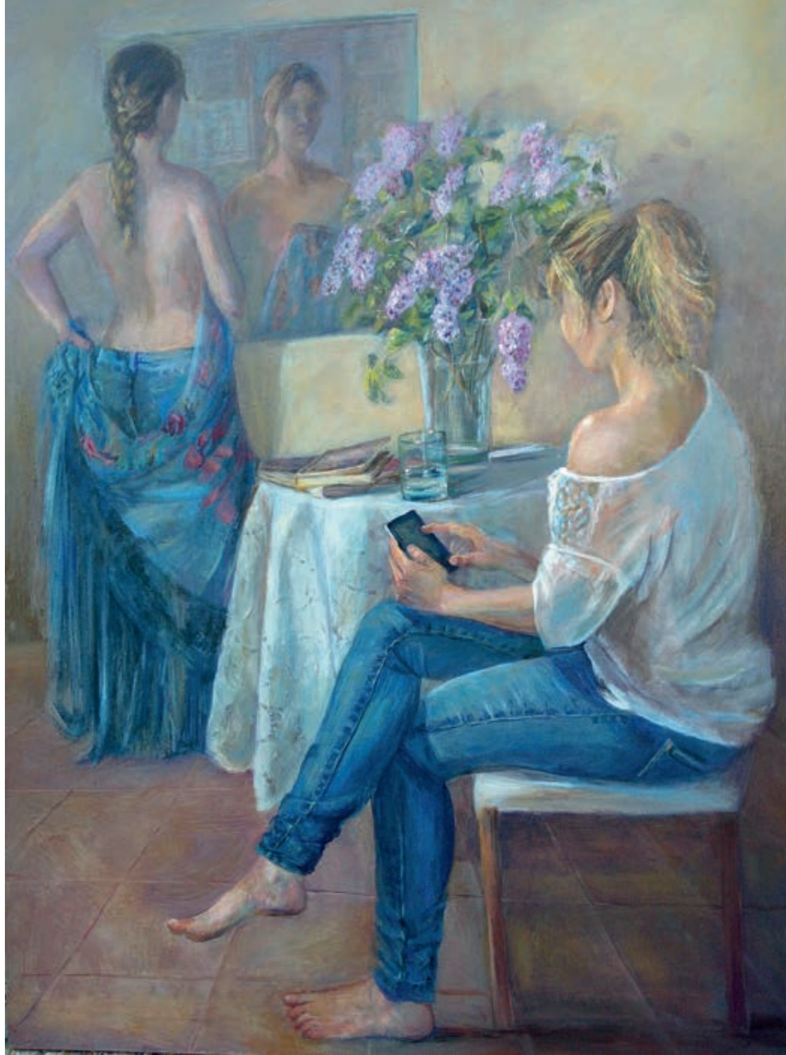
Provándose el mantón. Óleo/lienzo..116x89