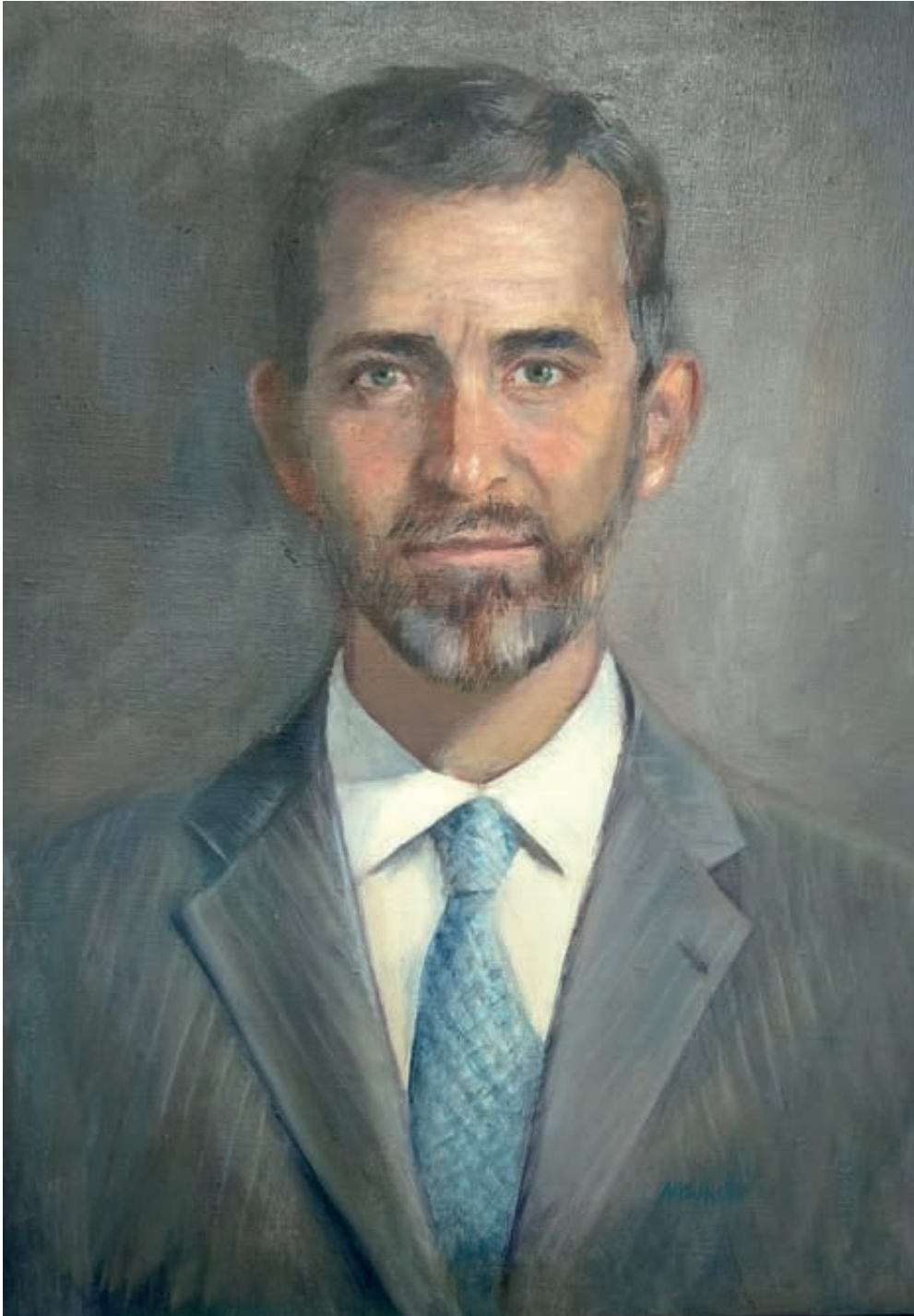
Felipe VI. Óleo/lienzo. 73x54.