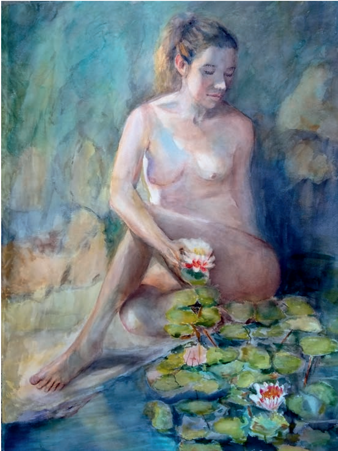
Ninfa de nenufares Acuarela. 109x78