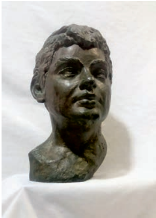
Jose Angel. Poliester con patina. 35x17x17