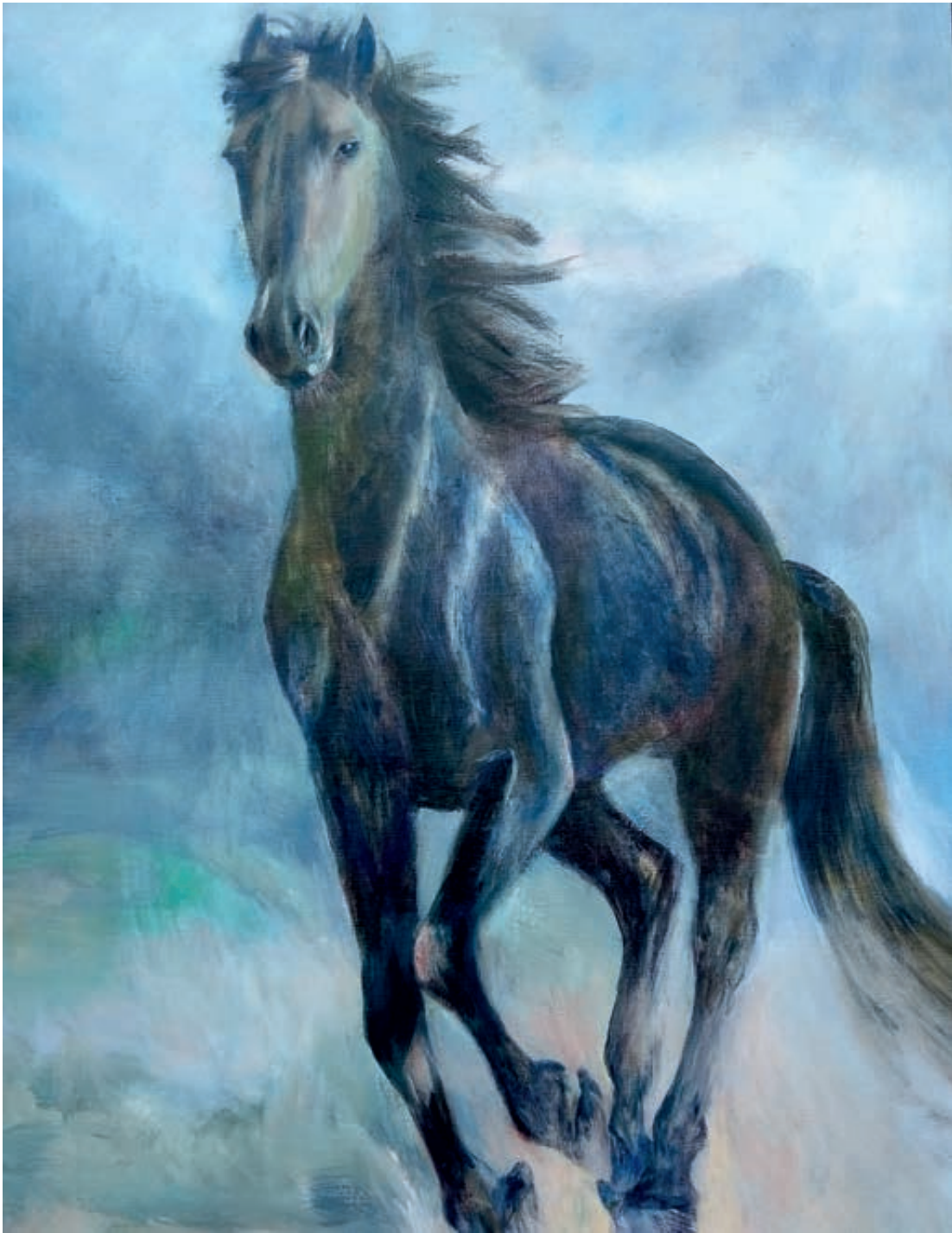
Tormenta. Óleo/lienzo. 116x89