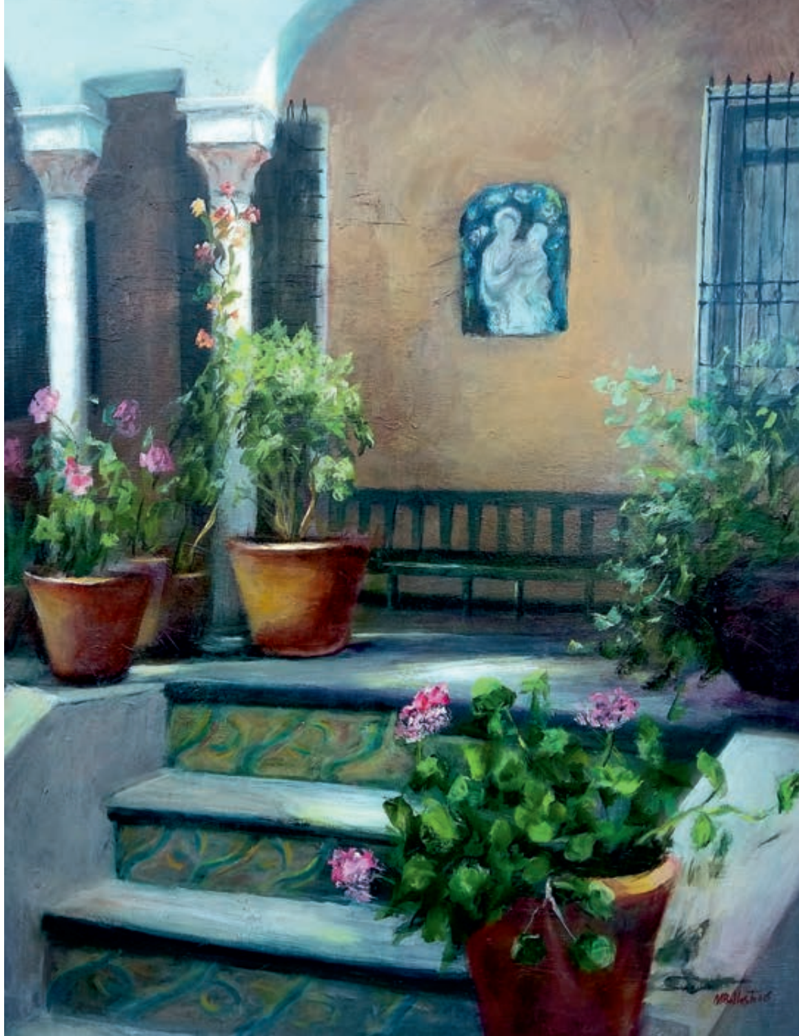
Jardín de Sorolla I. Óleo/lienzo. 100x81