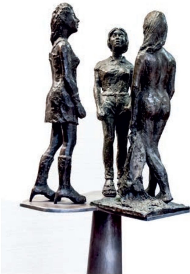
TRES.G. Bronce/p. aluminio.120x40x40

Es una muestra versátil de técnicas y estudio de las formas plasmado en los soportes diferentes que utiliza para desarrollar su obra. Sus percepciones de la naturaleza y de los objetos merecen la pena, porque acepta lo que la vida nos ofrece día a día, y ella lo plasma con dedicación y entusiasmo para legarlo a la humanidad. Su trabajo como pintora de caballete y acuarela es abundante en series de su tierra manchega y ha sido distinguida con premios”