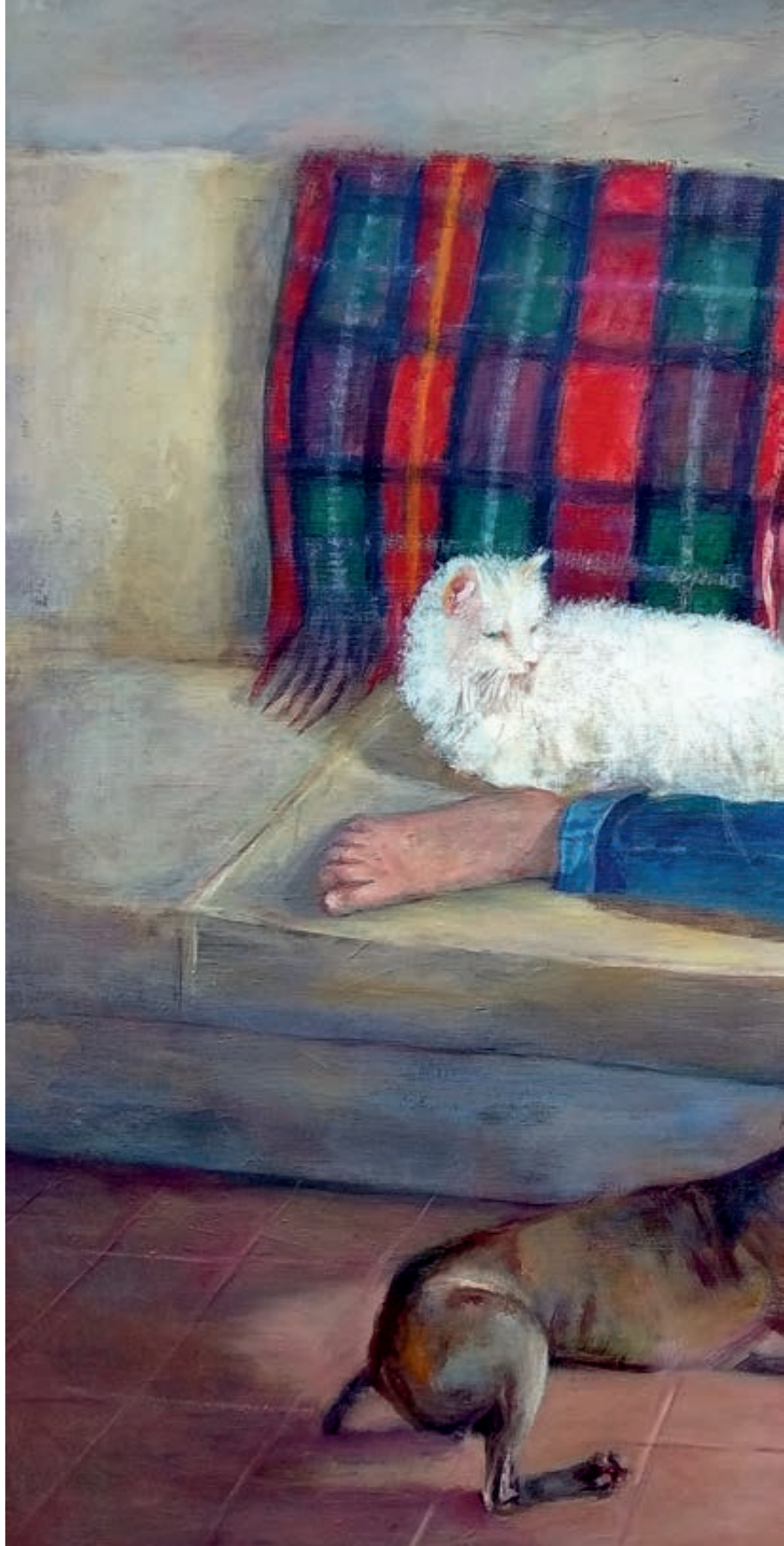
Mi Mascota. Óleo/lienz. 114x146