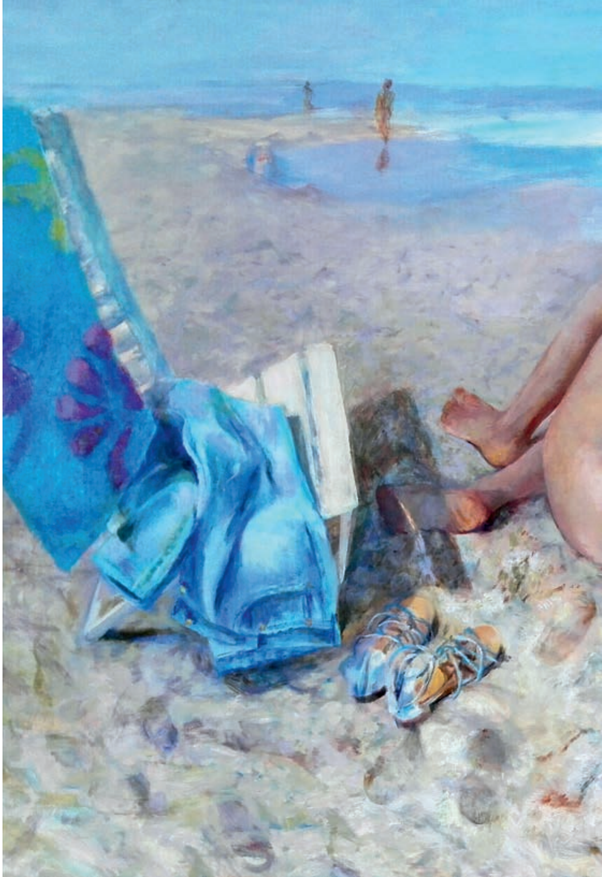
Relajacion. Óleo/lienzo. 122x195